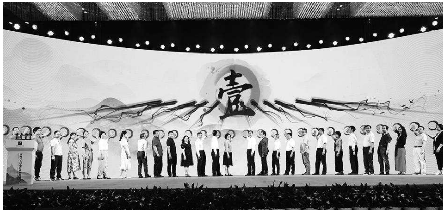
“新时代文学攀登计划”启动仪式

“新时代山乡巨变创作计划”是一项长期开展的文学行动,第一阶段自2022年开始,共五年,由作家出版社具体承办。起始阶段主要通过全国性稿件征集和中国作协各部门专家推荐,遴选和发现潜力作者和作品。作品体裁须为原创长篇小说,内容主要展现新时代中国农业农村农民在经济、生活、文化等方面的巨大变