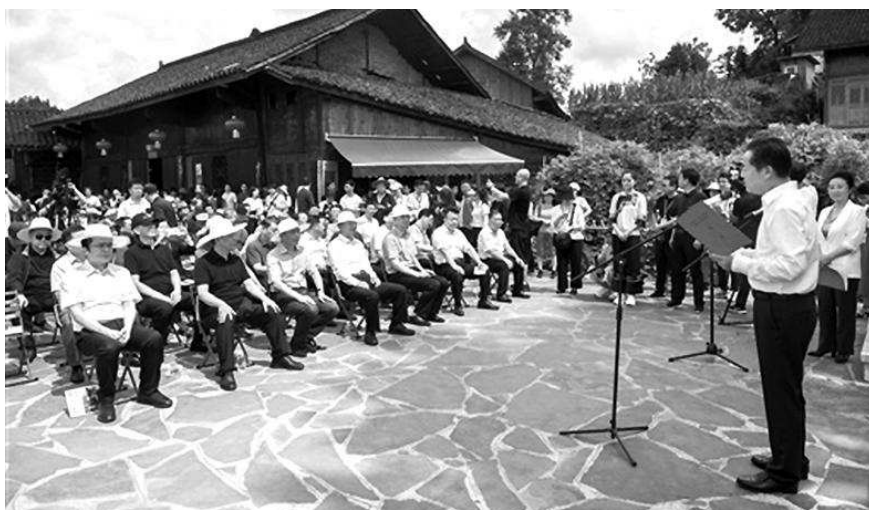
与会作家前往精准扶贫首倡地花垣县十八洞村参观学习

化。截至6月30日,作家出版社共收到来稿603件,初步选出18部作品,并就部分人选作品组织召开了改稿会。今后,中国作协将进一步积极有序推进相关工作,整合优势资源力量,深化资源共享与合作机制,继续做好稿件征集、遴选论证、融合出版、营销宣传等工作,努力创造配得上新时代新征程的文学新经典。