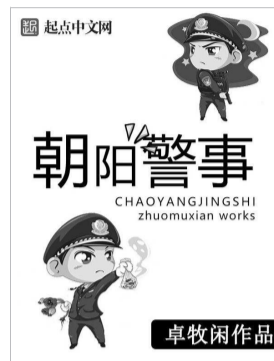
卓牧闲创作的《朝阳警事》《韩警官》等聚焦基层民警作品的作品一度引领了题材热点。

传统文化的承继问题,目前正在连载的新作《戏法罗》依然与传统曲艺相关。他认为,只有采用现实主义创作方式才能更好地呈现前辈艺术家艰苦奋斗的故事。